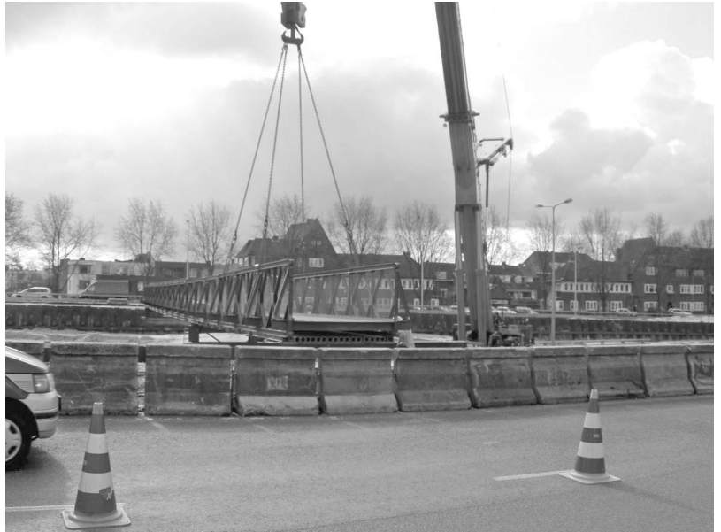
Bij het Meeuwenei is vorig week de hulpbrug voor fietsers en voetgangers op zijn plaats gehesen.

12: Als het tweede tunneltje, het tunneltje in het Volewijkspark bij de Noorderster ook gesloopt wordt (gepland in het voorjaar van 2007), is de hulpbrug bij het Meeuwenei ook de vervanging van deze fiets- en voetgangerstunnel. Voor scootmobielen, rolstoelen kinderwagens en rolstoelen stelt dit eisen aan de aansluiting op Adelaarsweg en op de brug over Noord-Hollandskanaal.