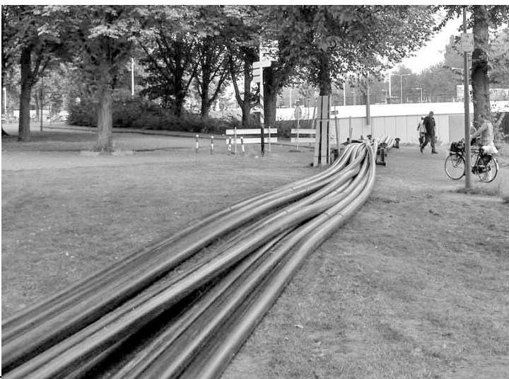
Buizen voor de boringen langs de Buiksloterweg vorige zomer.

Voor de boringen is men op dit moment bij de Oude Leeuwarderweg een werkterrein aan het inrichten. De boringen (van de rozentuin in het Florapark onder kanaal en NZlijn naar Noorderster) zijn voor verdieping van gas-, water-, electriciteit- en communicatie-leidingen. De boringen zullen lijken op die bij de Buiksloterweg vorig jaar zomer, maar met buizen tot 50 à 80 cm. Het boren is gepland voor mei-juni. Daarna worden in het park tussen IJtunnelweg en kanaal dwarsverbindingen vervangen. Daar is de omleiding van het fietspad voor.