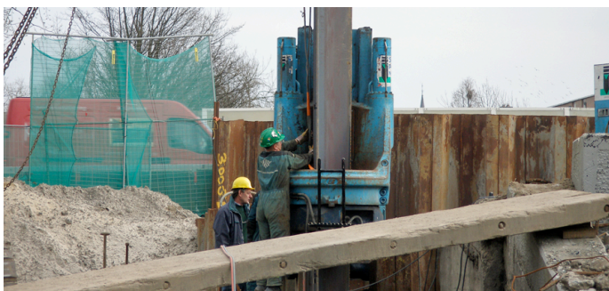
Silent piling (onder)