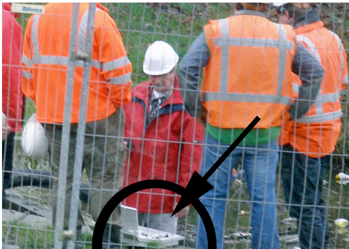
Meting chloorgehalte water in de sloot

Het waterpeil mag ook niet te laag, want dan droogt het veen uit waar de huizen langs de paden achter de Nieuwendammerdijk op rusten (zeg maar drijven). Als het veen droogt, verteert het en zakken de huizen het water in. Vandaar dus de belangstelling van het waterschap voor de duiker.