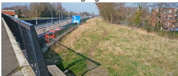
Kaagmanpad vanaf het viaduct gezien. Aan de overkant van de NLW loopt de bouwweg.