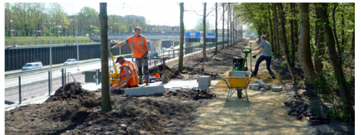
Tussen de noodtrap en het lindenlaantje zijn tegels gelegd op 8 april 2011.

Het lindenlaantje is aangelegd als uitweg voor de noodtrap van de verlaagde NLW.