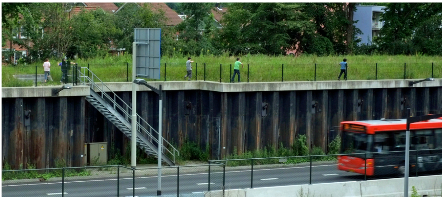
Woensdagmiddag, kinderen spelen op het Kaagmanpad langs de Nieuwe Leeuwarderweg.