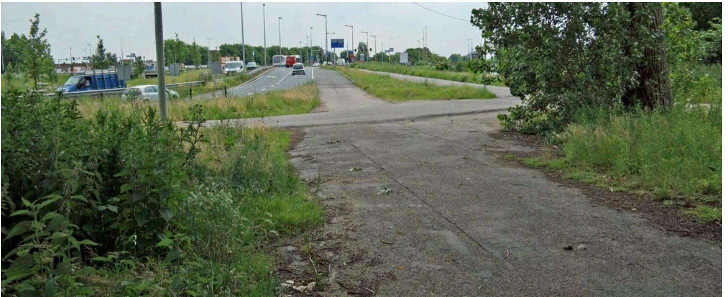
Het Peter Wittepad heeft een rechte verbinding naar een invoegstrook van de NLW.

en rijden spook over de afrit van de botonde. De beheersters van het gebouwtje vertelden dat het bedrijf dat de vloer kwam leggen een fikse boete had gekregen toen ze voor de deur stonden met een vracht planken. Er gaan echter nog geregeld auto's naar het roze gebouwtje. De beheersters verwijzen hun gebruikers naar de Leeuwarderweg of het parkeerterrein bij het politiebureau.