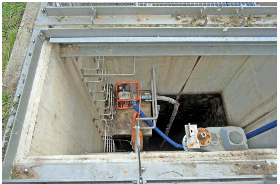
De toegang tot de duiker met klimbeugels en een tussenplateau.

De sifonduiker onder de verlaagde Nieuwe Leeuwarderweg (NLW) is af. Het verwijderen van het tunneltje, het verleggen van alle leidingen en het verlagen van de duiker is in Noord het hoofdpijn punt van de NZlijn geweest. De duiker zorgt voor de uitwatering van de ringvaart van de Buikslootmeer op het NHkanaal. Er zijn klimbeugels aangebracht, de duiker is geïnspecteerd en er is een nulmeting gedaan van de ligging van de duiker. Klaar.