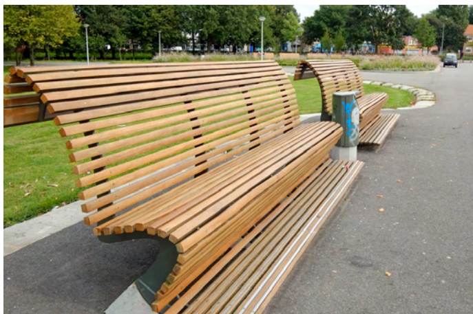
De banken in Volewijkspark-oost zijn schoon!

Van het Kaagmanpad lieten we in de vorige nummers al twee stukken zien. Het is een lang olifantepad. Hier het stuk van de Waddendijk naar de botonde. Nu het ambtenarenfietspad bij het Clusius College wordt afgesloten is het Kaagmanpad een prima alternatieve route. Zie de achterpagina.